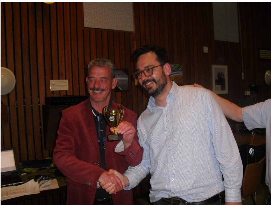
De oude en de nieuwe clubkampioen.